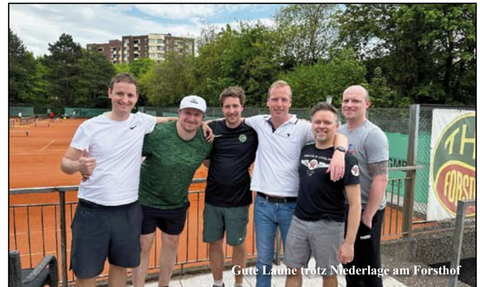
Gute Laune trotz Niederlage am Forsthof