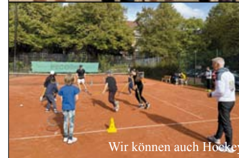
Wir können auch Hockey