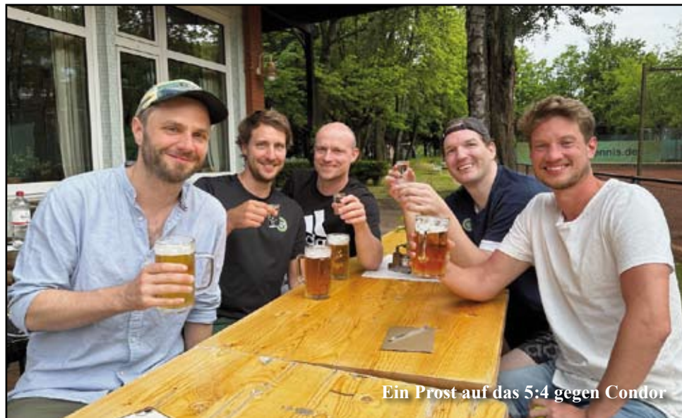
Ein Prost auf das 5:4 gegen Condor

Nach mehr als einem Monat Pause und genügend Zeit zur Regeneration stand das erste Heimspiel gegen Condor auf dem Programm. Wie immer sind wir mit einer vollzähligen, top motivierten Mannschaft angetreten. Und diesmal konnten wir uns, trotz unserer bereits bekannten Doppelschwäche, einen knappen Sieg schnappen. Wie man es sich denken kann – mit 5:4.