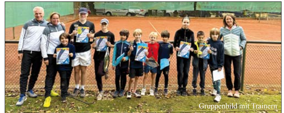
Gruppenbild mit Trainern