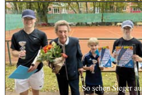
So sehen Sieger aus