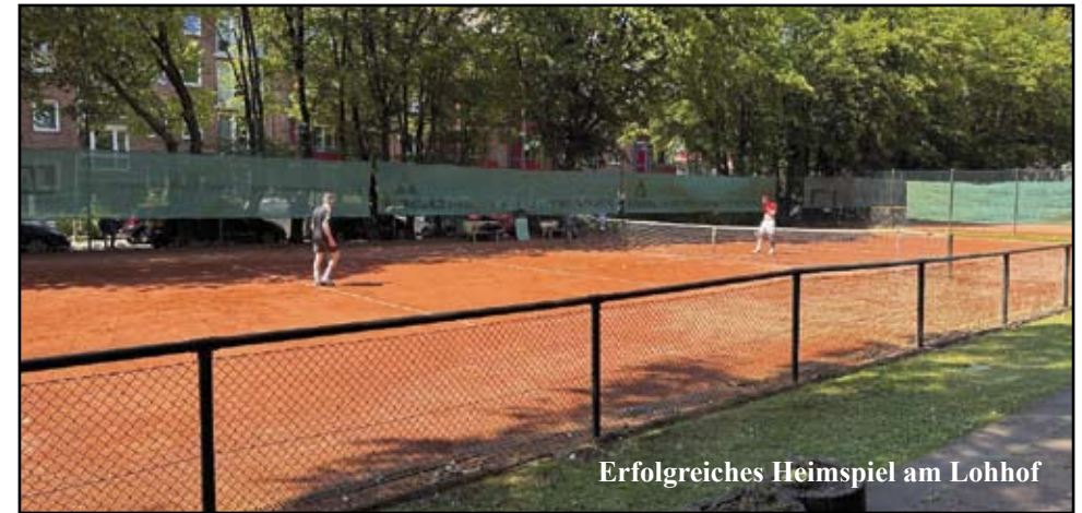
Erfolgreiches Heimspiel am Lohhof

Das kulinarische Highlight stand dann beim letzten Saisonspiel gegen TG Bergstedt-Wensenbalken – kurz TGBW – an. Spielerisch lässt es sich schnell zusammenfassen: - wir waren mit insgesamt 4:14 Sätzen maximal chancenlos. Essenstechnisch lief's positiver. Es wurde gegrillt und der Abend feucht fröhlich beendet.